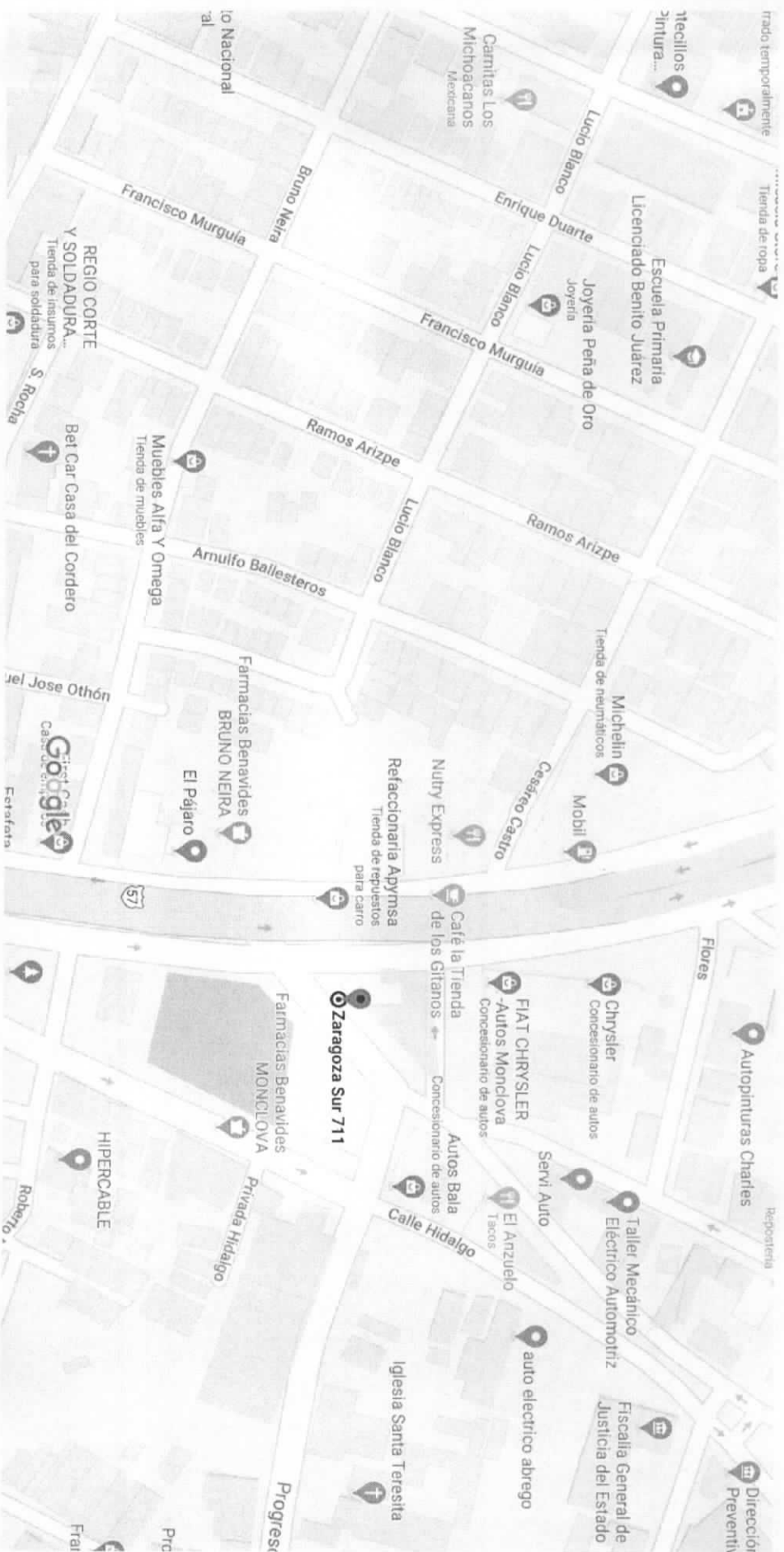
Datos del mapa © 2020 INEGI 50 m

Boulevard Harold R Pape sn esquina con calle Zaragoza zona centro Monclova Coahuila. C.P. 25700