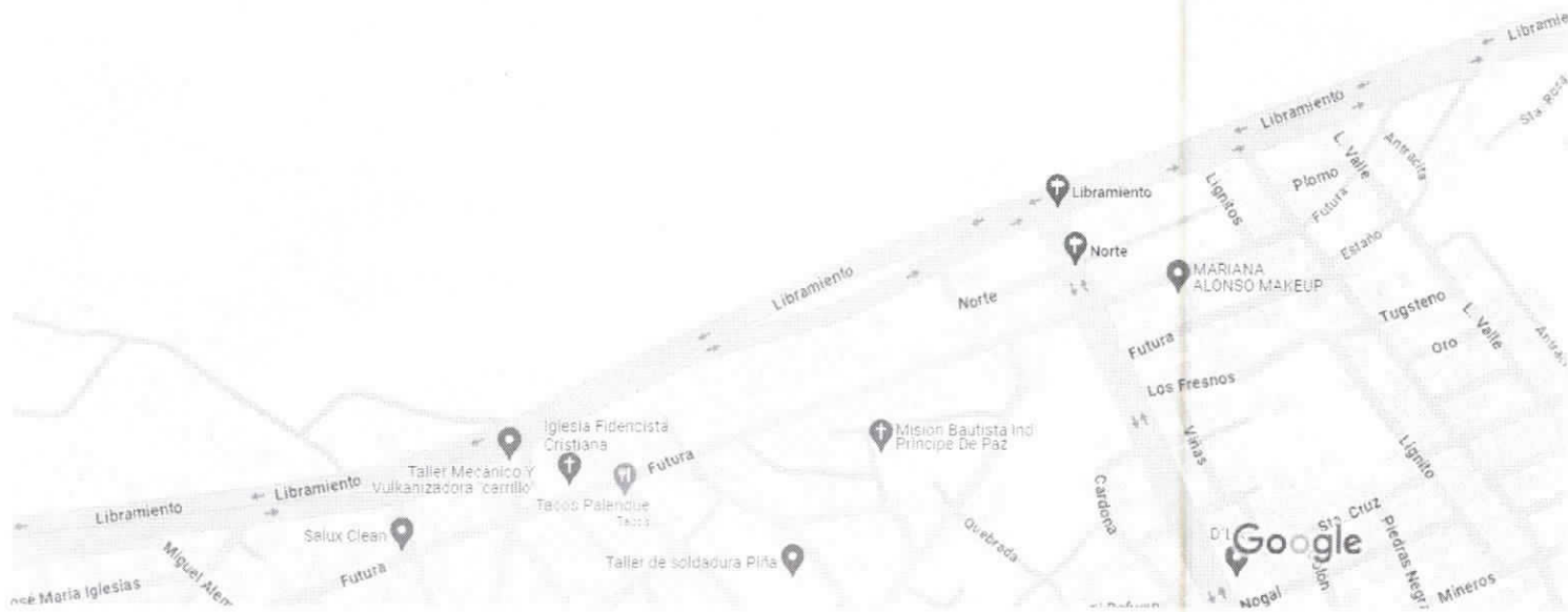
Datos del mapa © 2023 INEGI 100 m