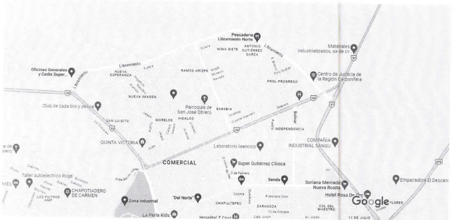
Datos del mapa © 2023 INEGI 200 m