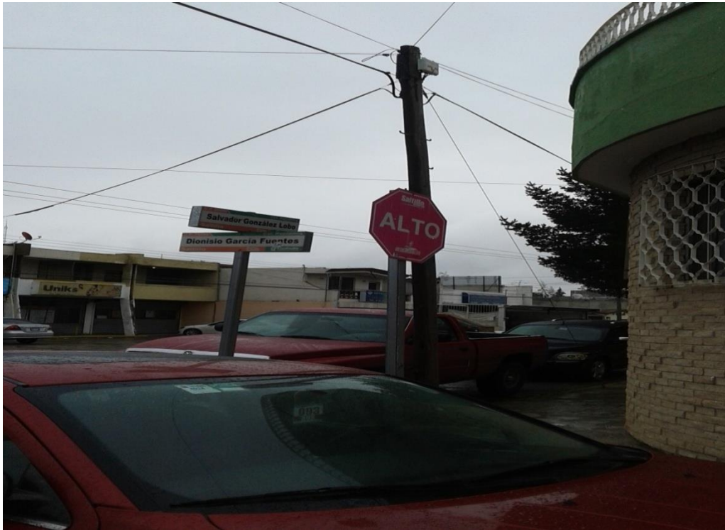
Imagen del frente del domicilio: