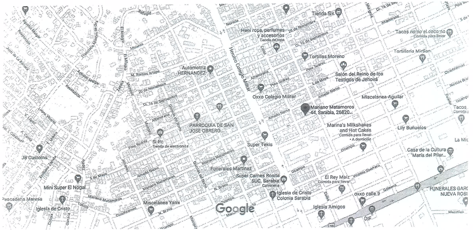
Datos del mapa ©2021 INEGI 100 m